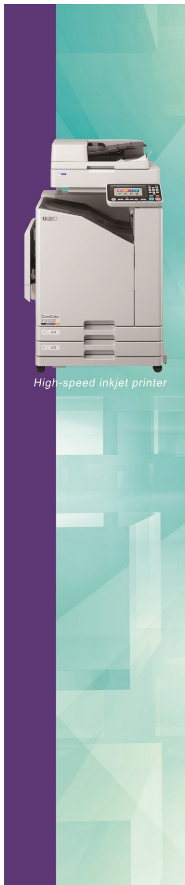
High-speed inkjet printer